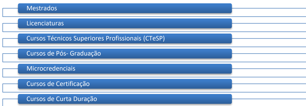
Figura 1 - Oferta formativa da ESTSetúbal/IPS.

A Escola Superior de Tecnologia de Setúbal é uma unidade orgânica de ensino superior e investigação, integrada no Instituto Politécnico de Setúbal (IPS), conforme estipulado pela lei e pelos estatutos do IPS. Detém uma atuação privilegiada nas áreas das engenharias e tecnologias. Em consonância com a promoção da cooperação institucional pelo IPS, a mobilidade da sua comunidade académica, a transferência e valorização económica do conhecimento, bem como o acesso dos cidadãos ao ensino superior e à aprendizagem ao longo da vida, a ESTSetúbal/IPS mantém uma constante preocupação em aliar elevados padrões de exigência à qualidade do ensino tecnológico e científico que oferece. Desta forma, abrange um amplo espectro de público, disponibilizando uma vasta oferta formativa composta por vários tipos de formações (Figura 1).