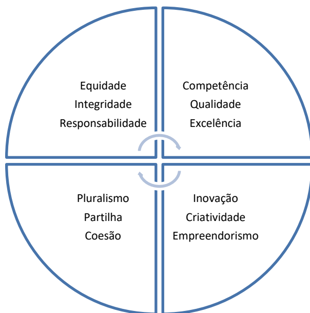
Figura 2 - Valores fundamentais da ESTSetúbal/IPS.